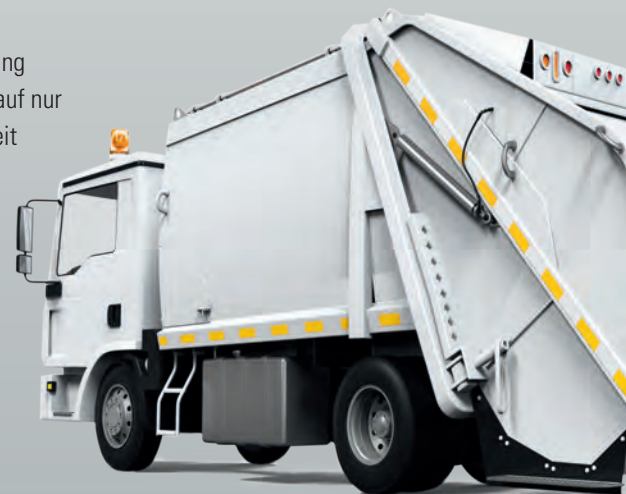
Andreas Seider Peter Fink GmbH

„Der abteilungsübergreifende Workflow zur Rechnungsprüfung reduziert die Durchlaufzeiten der Belege von drei bis vier auf nur noch ein bis zwei Tage. Wir konnten dadurch nicht nur Zeit und Geld sparen, sondern unseren Mitarbeitern auch die Arbeit erleichtern.“