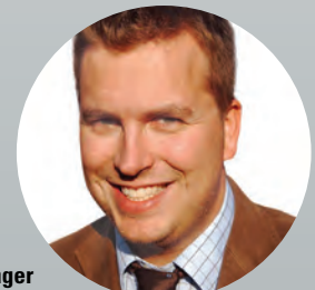
Oliver Langer Nürnberger Gewerbemüll Verwertung

Die Software zeigt sich als sehr gut strukturiert und ausgereift, sodass die Ausgaben enorm reduziert wurden und Anfragen ohne aufwändige Suchaktion sofort und direkt am Arbeitsplatz beantwortet werden können“